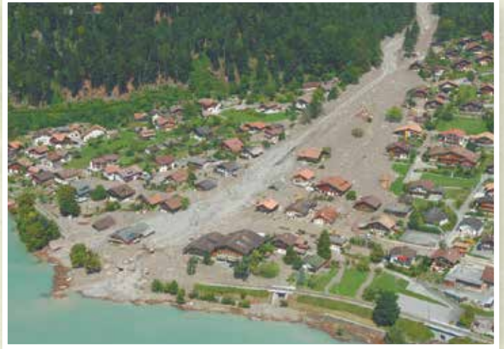
2005年 ブリエント スイス