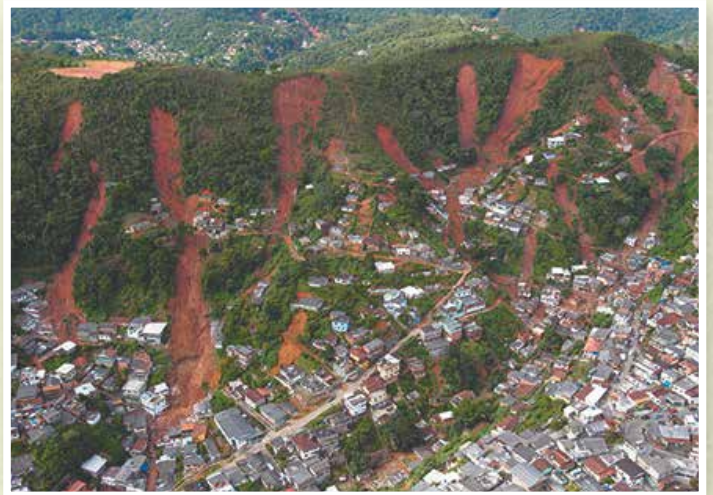
2011年 リオデジャネイロ ブラジル