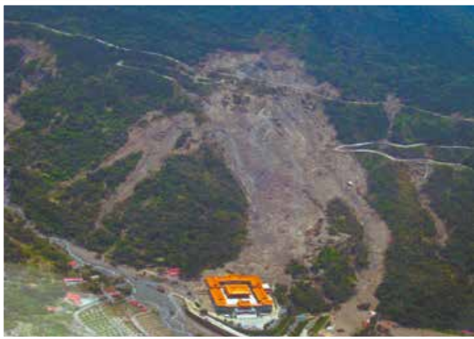
2009年 高雄市 台湾