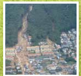
広島県安佐南区八木で発生した土砂災害