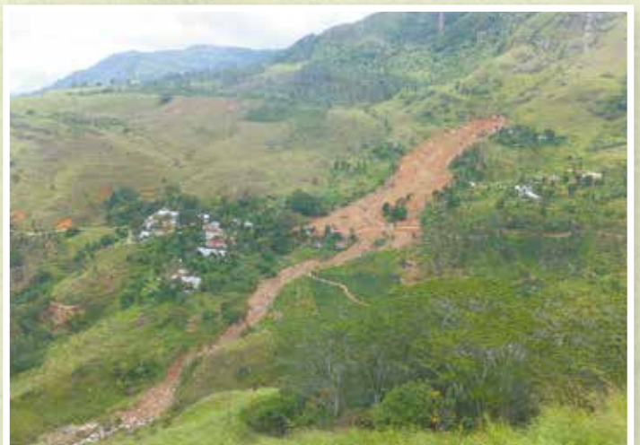
2014年 コスランダ スリランカ