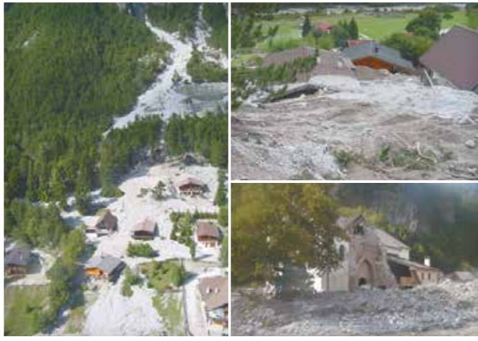
2003年 フェッラ川 イタリア