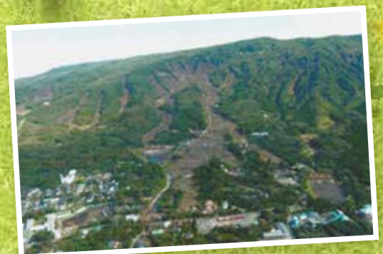
伊豆大島で発生した土石流災害